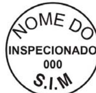
Modelo 3: 4cm de diâmetro